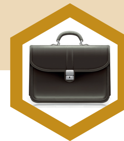
СФБ со право на 30% ПОПУСТ