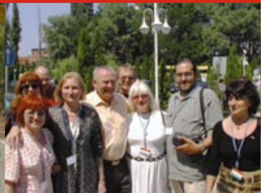
Квалифицираните български дистрибутори с Рекс Моан