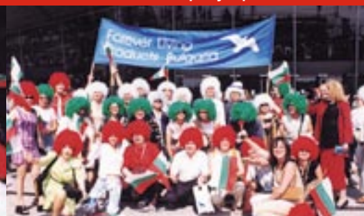
Българската група пред Арена Спорт