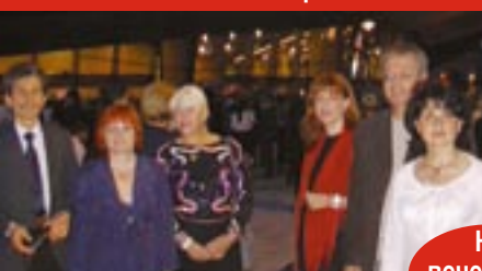
На вечерното парти