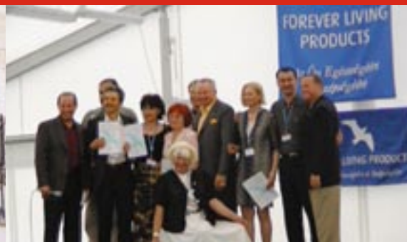
Награждаване на квалифицираните дистрибутори