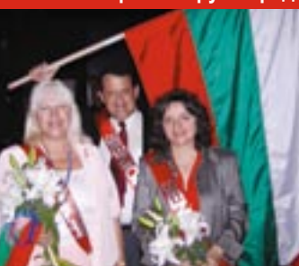
Награждаване на българските сеньор мениджъри