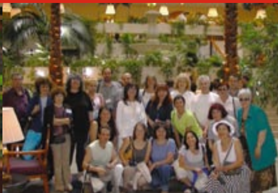
Българската група в х-л „Хаят“