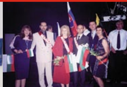
Награждаване на българските мениджъри