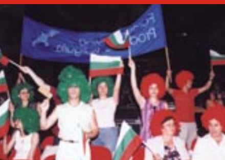
Настроение в залата