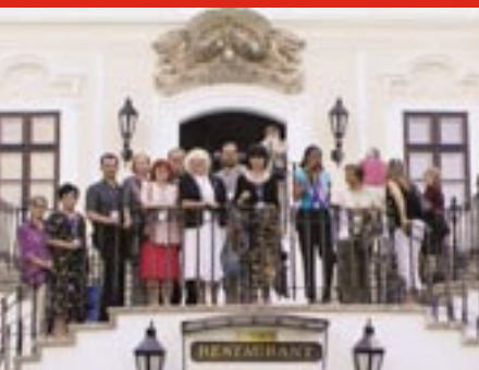
Квалифицираните в замъка Szirák