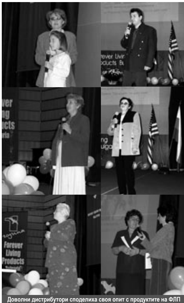
Доволни дистрибутори споделиха своя опит с продуктите на ФЛП

Успехът идва при тези, които изграждат своя дом упорито, камък по камък, които проявяват еднакво старание, както за първия, така и за последния камък, и винаги си казват, че най-важният камък е този, който полагат в момента.