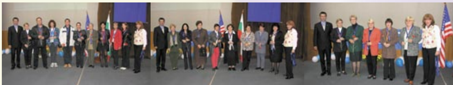
Нови Асистент Супервайзори

Класацията се прави въз основа на груповия обем на АКТИВНИТЕ дистрибутори. (В скоби е позицията от предходния месец)