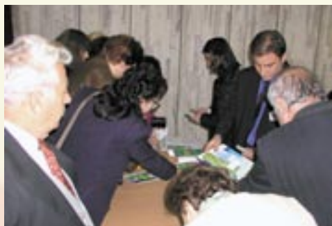
Много бяха желаещите да си купят книгата на д-р Атертон и да вземат автограф от автора