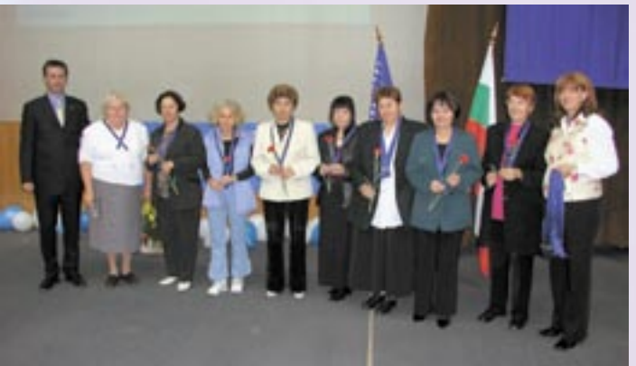
Нови Асистент Супервайзори