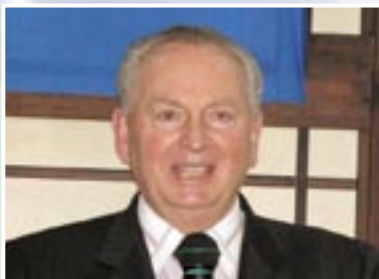
Президент и главен изпълнителен директор на FLP